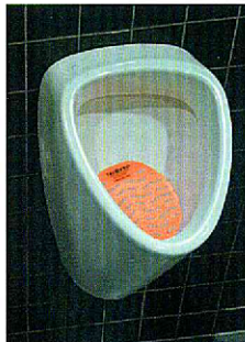
So platzieren das Spitzen nach oben zeigen.

U.S. Patent #8,007,707 Additional patent pending