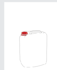
Kanister 12 kg Art.-Nr.: 2001483