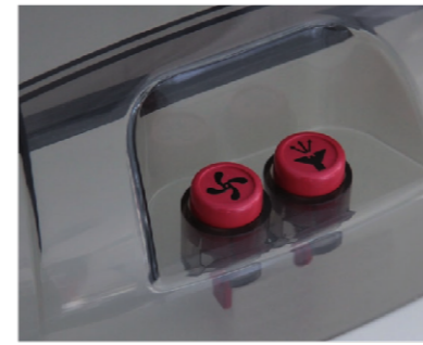
Sprüh- und Saugfunktion sind einzeln am Gerät zuschaltbar.