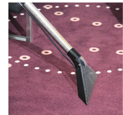
Glasklare Bodendüse mit langem Saugrohr zur bequemen, ermüdungsfreien Teppichreinigung.