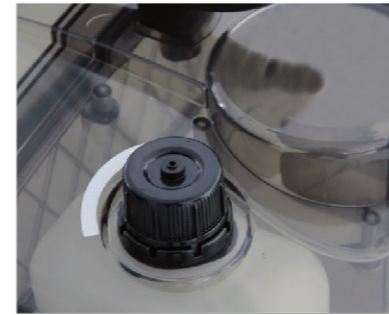
Ein separater Tank ermöglicht den Betrieb mit Entschäumer und garantiert damit ein kontinuierliches Arbeiten.