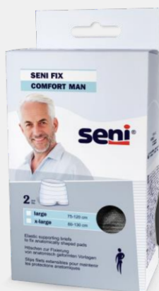
Seni Fix Comfort Man in maskuliner Optik