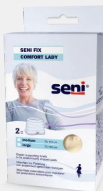
Seni Fix Comfort Lady im attraktiven, femininen Design